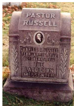
Charles Taze Russell

294 „Jeździec na białym koniu wyjechał.” Rozumiecie? Kim on jest? On jest potężny w swojej przewyższającej mocy. On jest wielkim osobnikiem w swojej przewyższającej mocy. Czy chcecie, abym wam powiedział, kim on jest? Jest to antychryst. Dokładnie tym on jest! Zatem, dlatego, że widzicie, jeżeli antychryst... Jezus powiedział, że „ci dwaj będą tak blisko siebie, że by to zwiódło nawet samych Wybranych (Oblubienicę), gdyby to było możliwe.” Antychryst! Jest to duch antychrysta. 295 Przypomnijcie sobie — w wiekach kościoła, kiedyśmy otworzyli pierwszy wiek kościoła wówczas, stwierdziliśmy, że Duch Święty był przeciw pewnej sprawie, która miała swój początek w tym wieku kościoła, a była nazwana „uczynkami Nikolaitów.” Przypominacie sobie? [Zgromadzenie: „Amen” — wyd.] Nikao oznacza „podbić.” Laity